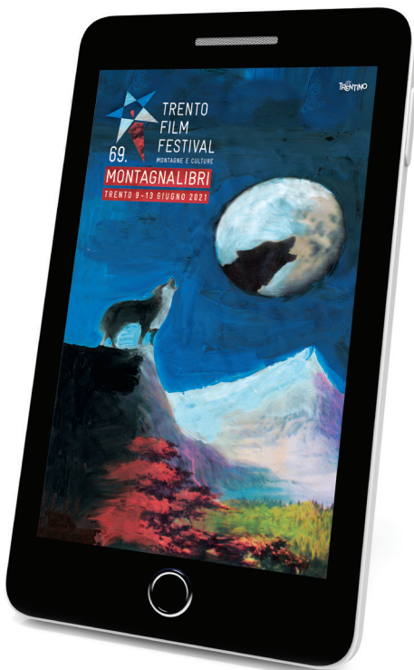
Plus / Artwork by Gianluigi Toccafondi