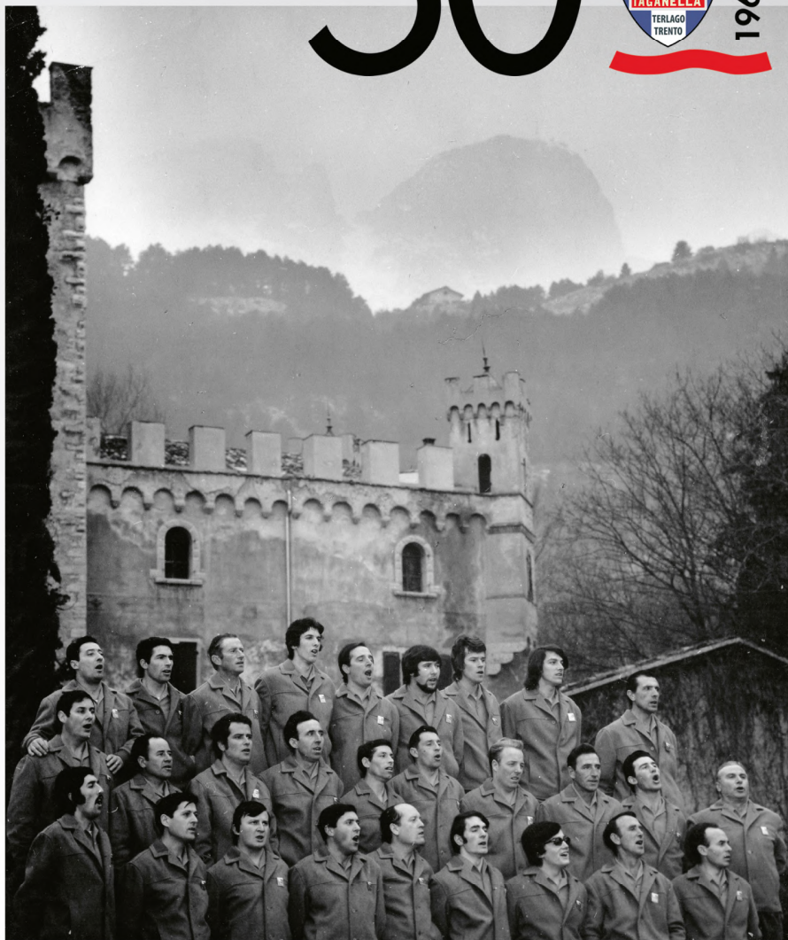
Coro Paganella, 1972